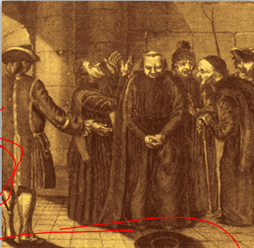
Gravura que satiriza o desamparo dos jesuítas ao serem expulsos da Colônia