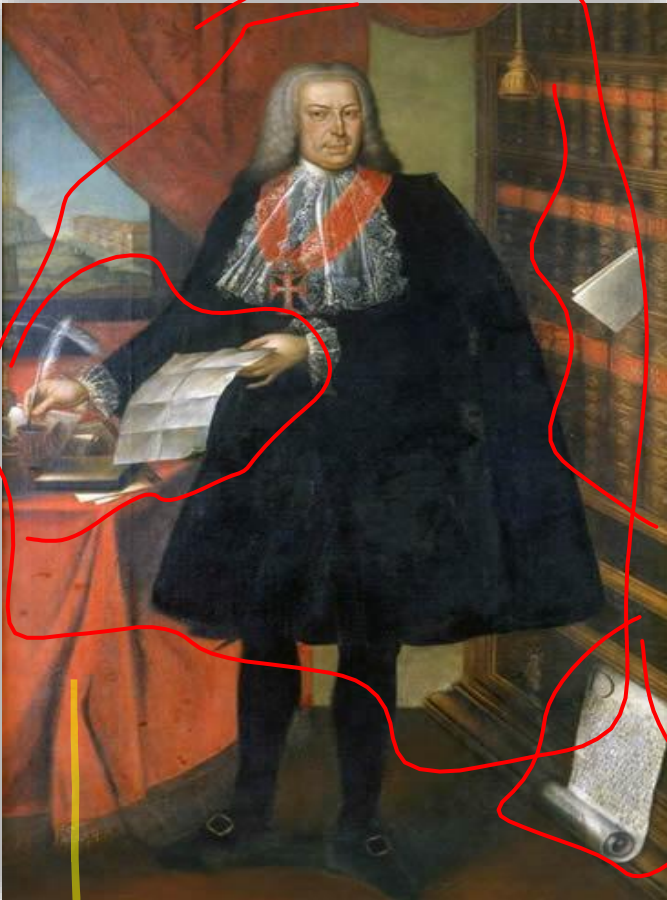
Retrato de Pombal. 1770. Joana do Salitre.