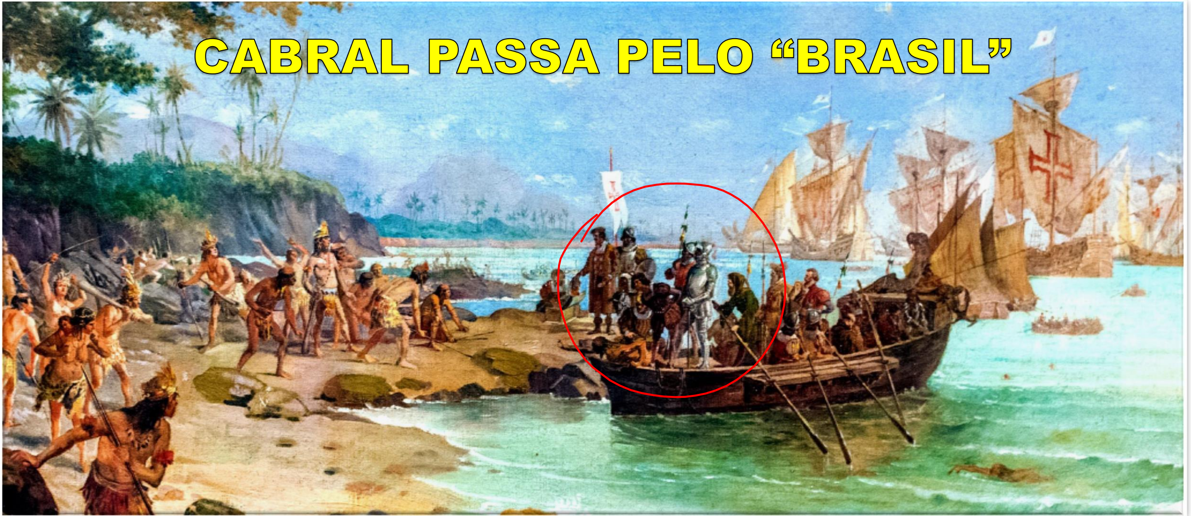
“Desembarque de Cabral em Porto Seguro”, quadro de Oscar Pereira da Silva (1904)